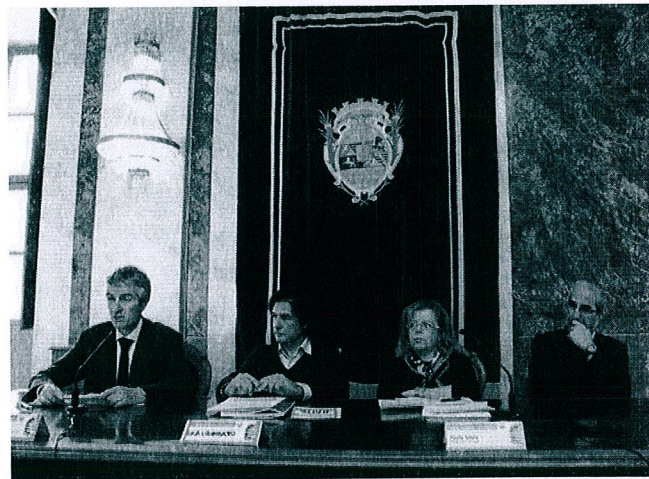
Le foto della conferenza stampa ed i protagonisti

NEWS DALLA PROVINCIA CSV INFORMA CHOCONEWS LAVORO IN PROVINCIA DI CUNEO QUATTROZAMPE SOROPTIMIST CLUB CUNEO MERCOLEDÌ MOTORI CONTRO COPERTINA DI TEATRO IN TEATRO RIDERE & PENSARE CONFARTIGIANATO NOTIZIE IMPRESE & LAVORO COMUNE DI CUNEO BUSCA NEWS